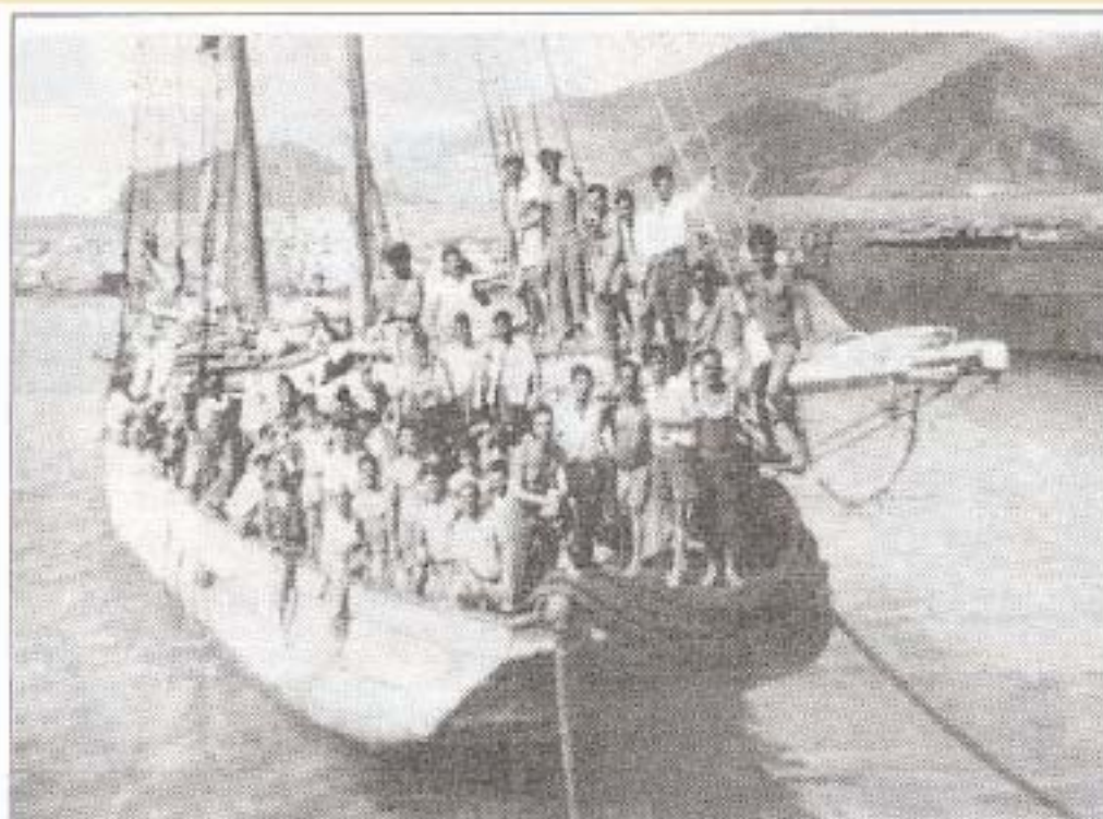
Imagen de los tripulantes de "La Elvira" a su llegada a Puerto de Garopano, Venezuela, en Mayo 1949